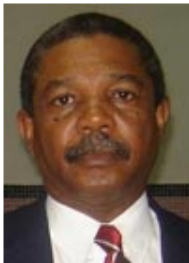
WILTON FERREIRA BARRETO (Rio de Janeiro)

ATUAL PRESIDENTE Mandato: 01/10/2006 à 30/09/2010